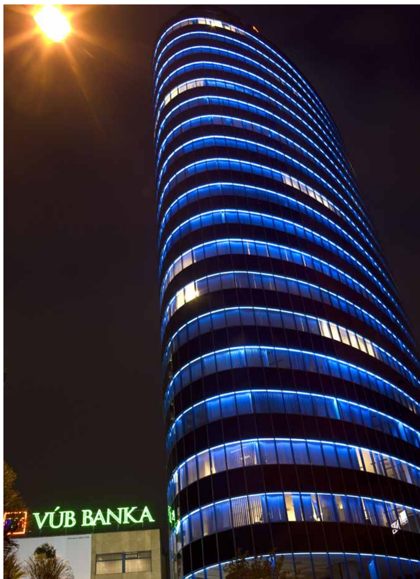
Ústredná budova VÚB má 1850 m nových, ekologických neónových trubíc plnených argónom

bolo opätovne sprevádzkované modré neónové nasvietenie budovy, ktoré bolo z dôvodu rekonštrukcie niekoľko mesiacov vypnuté. V priebehu prác bolo odstránených a spätne namontovaných 1 850 m nových, ekologických neónových trubíc plnených argónom.