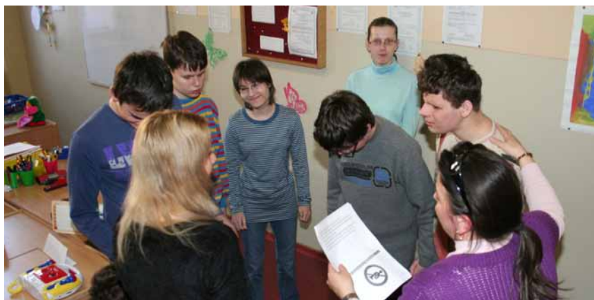
„Živé“ čítanie v internátnej škole pre nevidiace deti

Drvivú väčšinu nahrávok vo fondoch SKN vytvorili profesionálni herci.