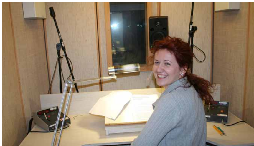
Dobrovoľníci z VSE zhotovujú zvukové záznamy rozprávkových knižiek pre nevidiace deti