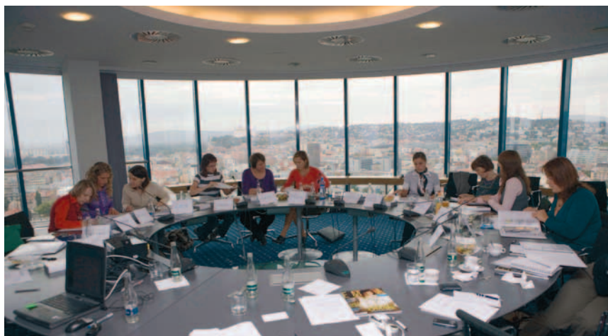
Do nového prieskumu VÚB banky sa zapojila takmer polovica z 2 600 zamestnankýň.

výber školení určených ženám po rodičovskej dovolenke vzhľadom na jej dĺžku, absolvovanie prvých školení po návrate z RD mimo bydliska minimálne až po prvom mesiaci s cieľom neodlúčovať matku od rodiny, okrem orga-