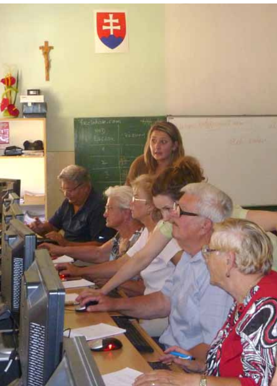
Nadácia Orange vyhlásila 4. ročník grantového programu Zelená pre seniorov

Spoločnosť Orange Slovensko, a.s., reaguje na tému aktuálneho roka, ktorý je Európskou úniou vyhlásený za Európsky rok aktívneho starnutia a solidarity medzi generáciami. Prostredníctvom Nadácie Orange podporuje túto medzinárodnú iniciatívu aj vyhlásením 4. ročníka grantového programu zameraného na zlepšovanie kvality života seniorov s názvom Zelená pre seniorov. Až 80 000 € bude rozdelených medzi užitočné projekty pripravené organizáciami z celého Slovenska, ktorým záleží na živote starších ľudí okolo nás. Nárast žiadostí o podporu o 58% oproti minulému roku svedčí o popularite programu aj aktuálnosti témy. Výsledky Nadácia Orange zverejní 30. apríla 2012.