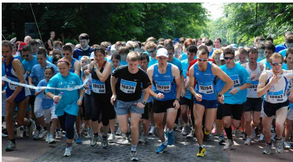
Zúčastnite sa 5.ročníka charitatívneho projektu Tesco Beh pre život!

Už 5. ročník charitatívneho projektu Tesco Beh pre život organizuje Nadácia Tesco v mesiacoch máj a jún. Prvý beh sa bude konať 5. mája v Bratislave. Doteraz sa na behu zúčastnilo takmer 28 000 ľudí! Športovci i nešportovci si môžu aj tento rok v mesiacoch máj a jún zmerať svoje sily v šiestich mestách – Bratislava, Prešov, Žilina, Nitra, Trenčín a Banská Bystrica. Celý výťažok bude venovaný na pomoc v boji proti rakovine.